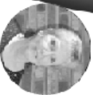
Chis ainc Moisse